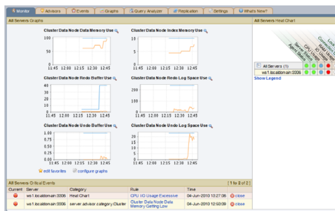
Figura 2. Gli advisor di MySQL Cluster suggeriscono le best practice e riducono i rischi di inattività

MySQL Cluster Manager semplifica la creazione e la gestione del database MySQL Cluster automatizzando le procedure più frequenti. Questo migliora la produttività dei DBA e degli amministratori di sistema, che possono così dedicare più tempo alle iniziative IT di natura strategica. Allo stesso tempo si riducono sensibilmente i rischi di inattività del database, che spesso sono frutto di errori nella configurazione manuale.